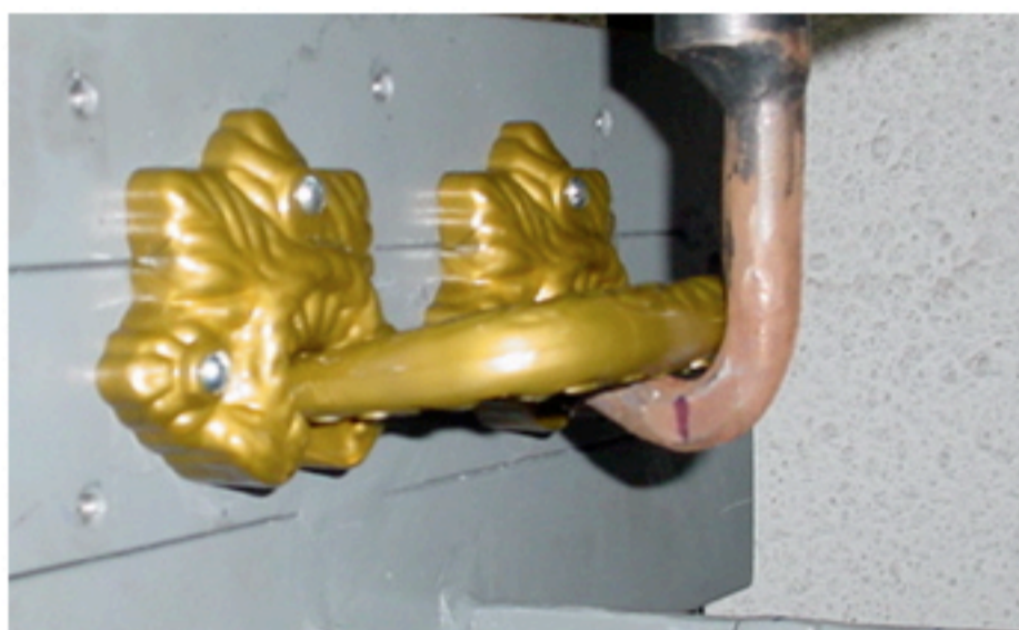
Foto 1. Conjunto montado na máquina de tração para a realização do ensaio.

OBJETIVO: Determinar a Resistência Máxima da amostra no ENSAIO DE TRAÇÃO.